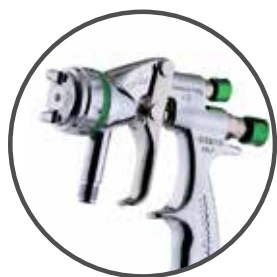
Walcom Genesi SP

Пневматические краскораспылители с принудительной подачей материала.