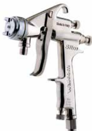
Walcom Slim SP