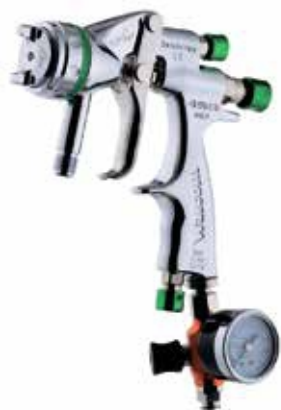
Walcom Genesi SP

Пневматические краскораспылители с принудительной подачей материала