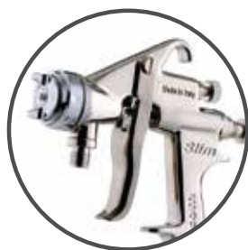
Walcom Slim SP