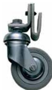
Комплект из 4-х колёс

К бачкам с верхней подачей – для быстрой замены цвета (типа) материала или промывки оборудования.